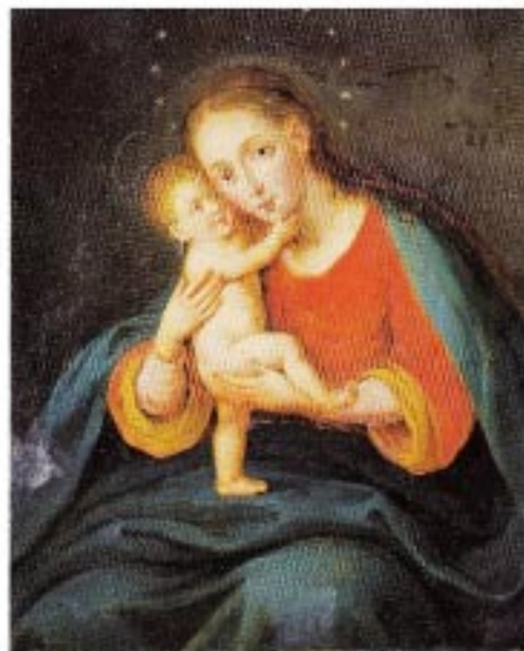
Helferin der Christen!

Sonntag, 29. Mai 2011, 6. Sonntag der Osterzeit 14.00 Uhr Feierliche Maiandacht mit Sakr. Segen